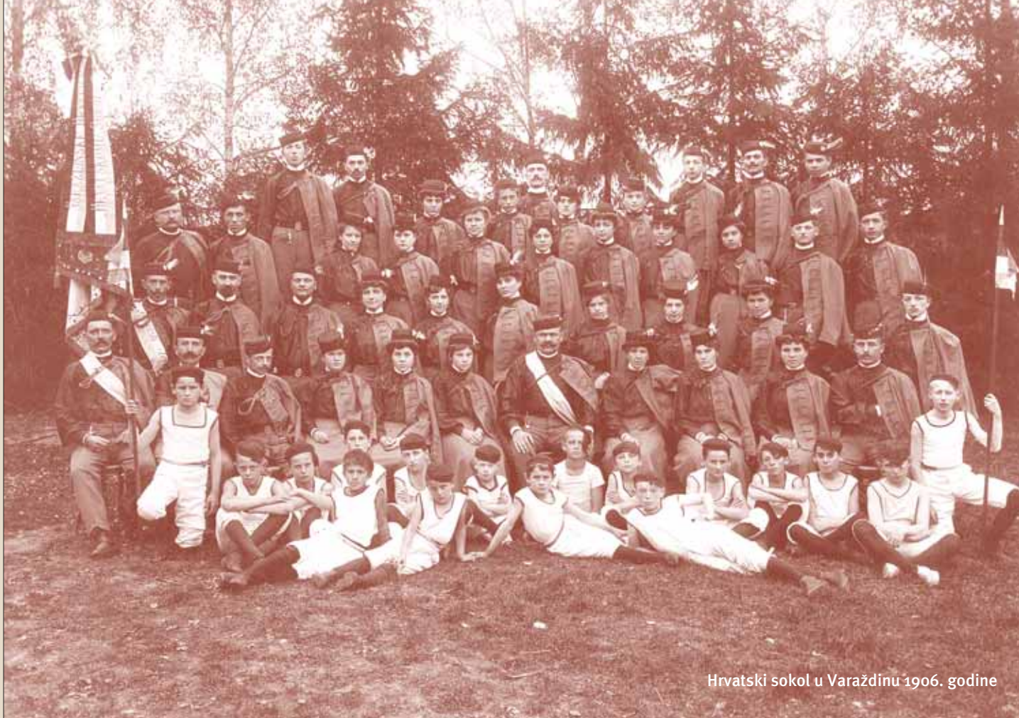
Hrvatski sokol u Varaždinu 1906. godine

Iz konteksta šire rodoljubne faktografije spomenimo neka Magdićeva temeljna postignuća. Kao prvo, obnovio je sokolstvo u Varaždinu i stao u njegove prve redove. Priredio je sjajnu posvetu zastave Hrvatskog sokola 1904. godine. Ta je svečanost prerasla u veliku manifestaciju probudene nacionalne svijesti. Kada je spoznao da je pre naglilo u entuzijazmu nakon stvaranja nove države 1918. godine, otvoreno je razotkrivao hipokriziju tadašnjih vlasti.